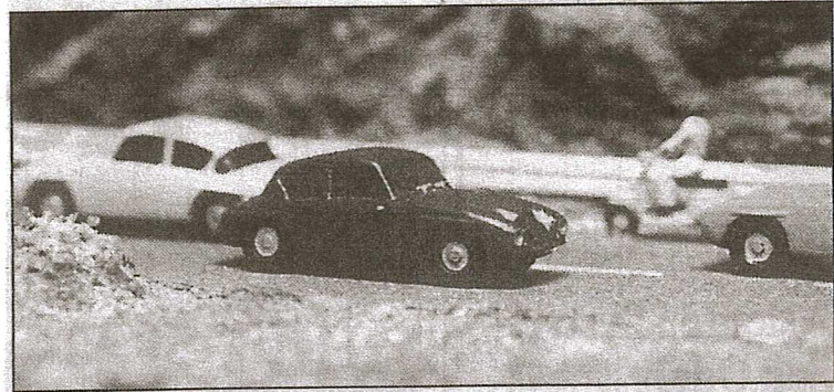
Det var vel slik bilpionerene i Telemark ønsket seg landeveien i 1960-årene: Troll på vei i alle retninger. Men bildet kan lure deg, modellbilene er under 5 cm lange

Også det tredje Troll'et av de fem som det fortsatt er liv i, er i Lillehammer-traktene. På Norsk Vegmuseum på Hunderfossen står tredjemann. Det har tilbrakt endel av sitt lange liv høyt hevet over hverdagen til fjells ved Vågåmo, og